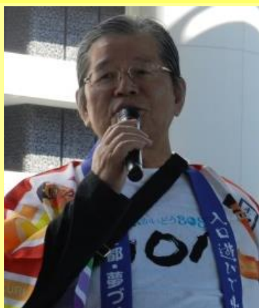
須知 なにわ八百八橋「橋洗い」実行委員長

【参加者】一般の方や北新地、近隣のホテル従業員などの地域の方々、100人以上が参加。