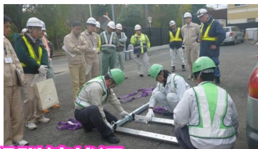
道路啓開訓練状況