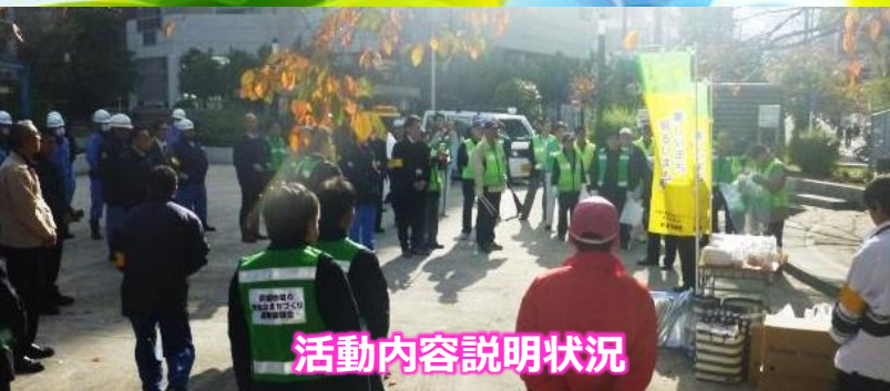
活動内容説明状況