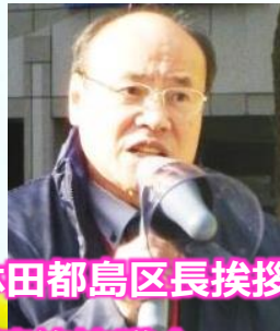
林田都島区長挨拶