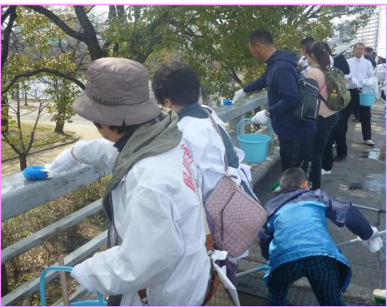
旧桜宮橋の清掃の様子