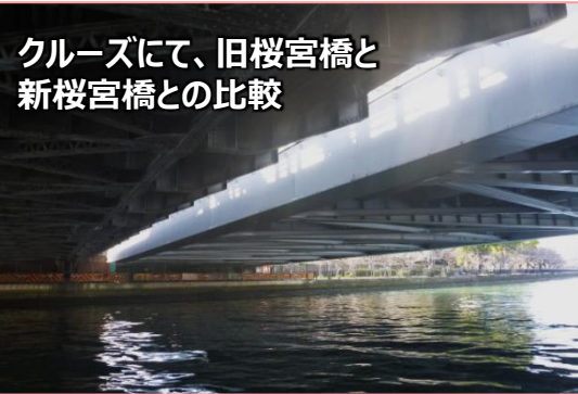
クルーズから見た桜宮橋