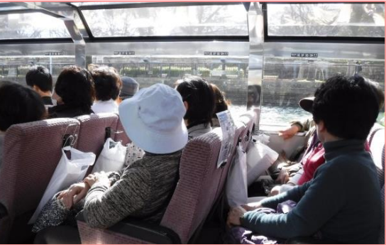
橋めぐりクルーズの様子