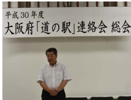
↑ 連絡会会長（太子町長）挨拶