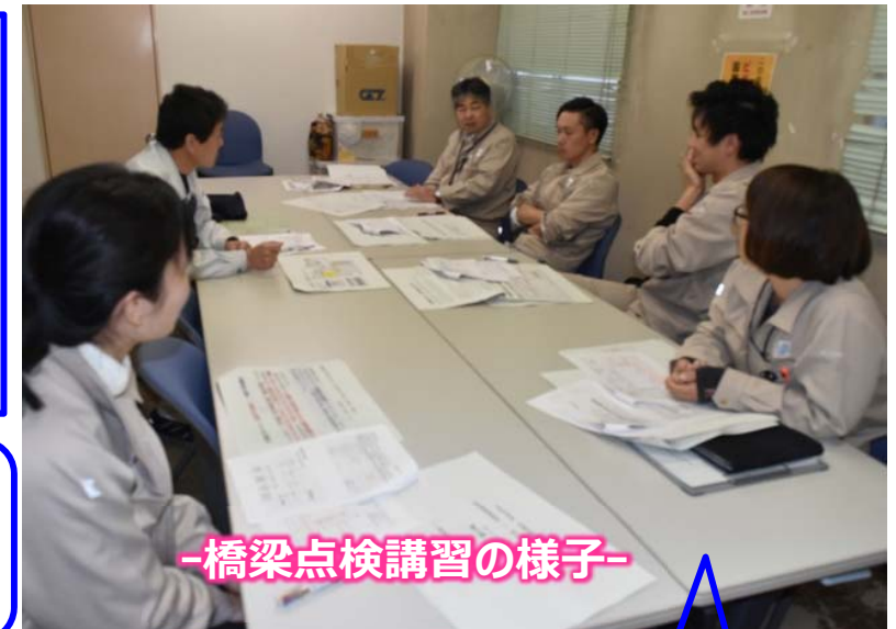
-橋梁点検講習の様子-