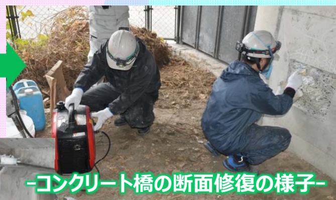
-コンクリート橋の断面修復の様子-