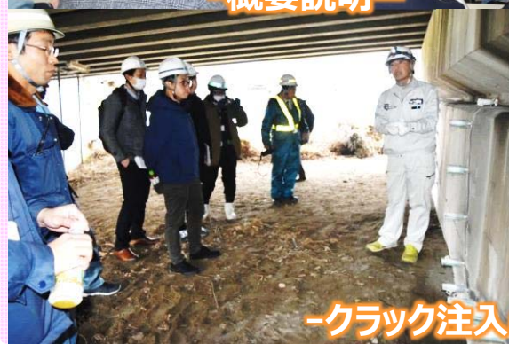
-クラック注入の説明-