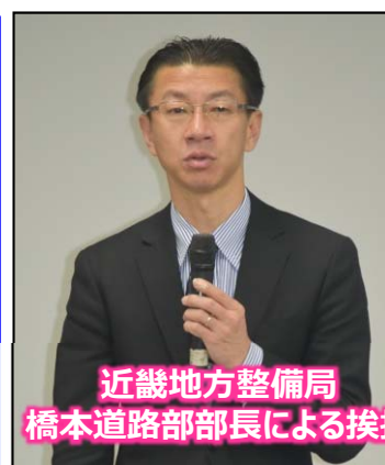
近畿地方整備局 橋本道路部部長による挨拶