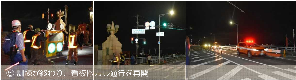
⑤ 訓練が終わり、看板撤去し通行を再開

防潮扉の閉鎖（点検・操作）訓練の実施にあたり、通行止め・迂回にご協力いただきありがとうございました。