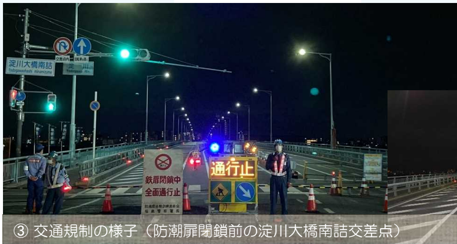
③ 交通規制の様子(防潮扉閉鎖前の淀川大橋南詰交差点)

「防潮扉(ぼうちょうとびら)」とは... 道路や鉄道があって堤防が途切れている箇所を鉄製のゲート等でふさぎ、暫定的に堤防の役割を果たすことで高潮等による浸水被害を受けないようにするものです。 * 平成30年の台風21号による高潮の際には、防潮扉でふさいだことで大阪市内等は浸水被害を受けませんでした。