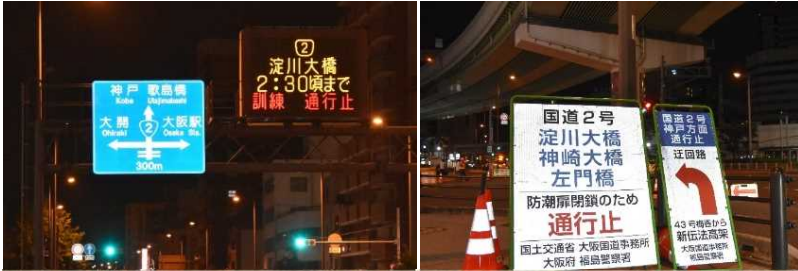
(参考) 現地に設置した通行止めや迂回路を案内する看板