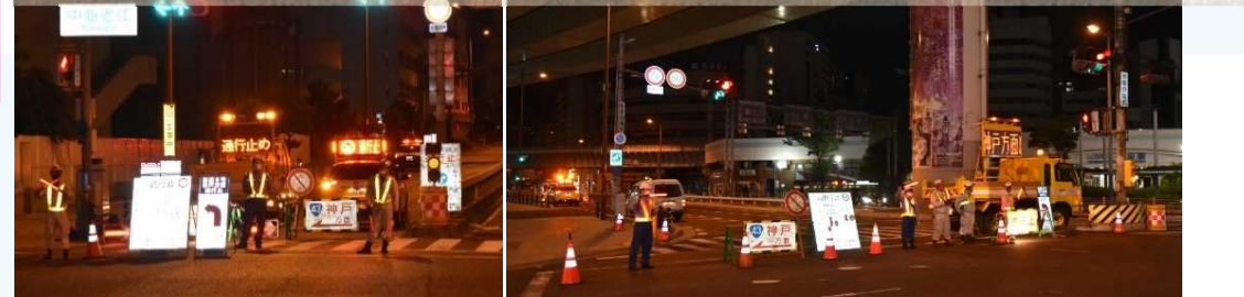
② 交通規制の様子(中海老江交差点、野田阪神前交差点)