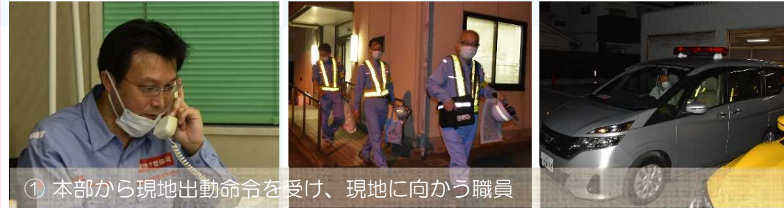
① 本部から現地出動命令を受け、現地に向かう職員