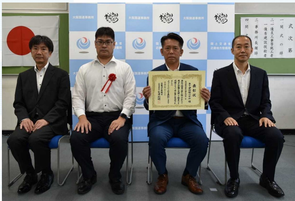
金下建設株式会社 様