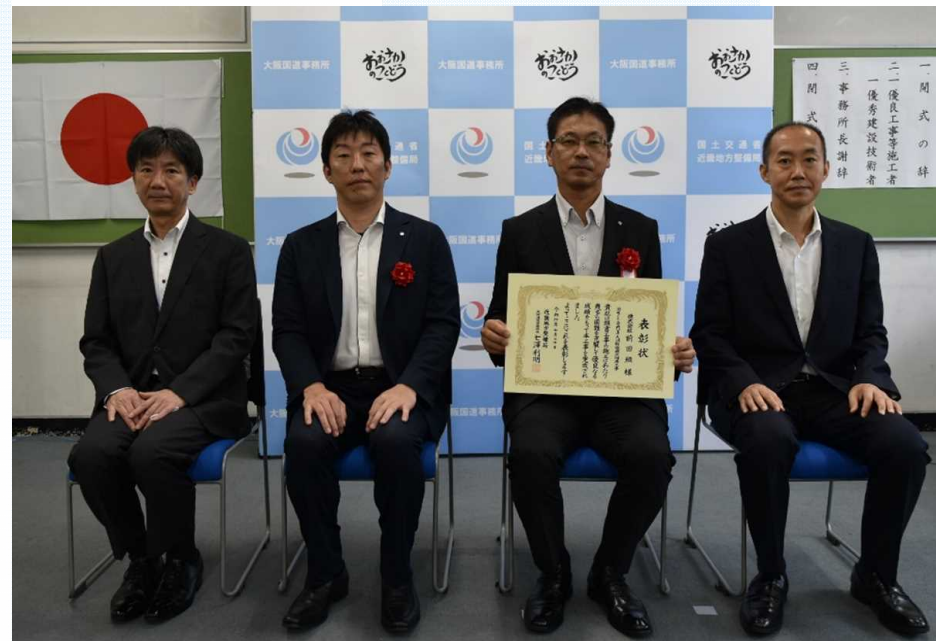
株式会社前田組 様