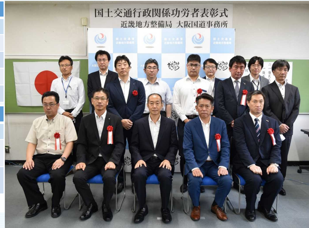
令和4年度優良工事等施工者事務所長表彰を受けられた皆さん