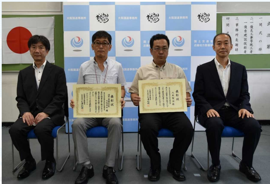
酒井工業株式会社大阪本社 様