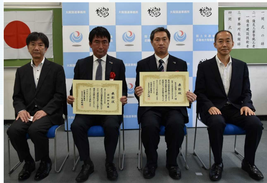
株式会社インシーク 様