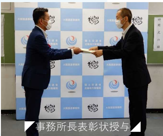
事務所長表彰状授与