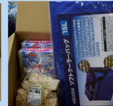
とっとパーク小島