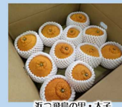
近つ飛鳥の里・太子