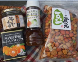
奥河内くろまるの郷