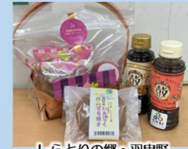
しらとりの郷・羽曳野