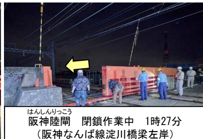
はんしんりっこう 阪神陸閘 閉鎖作業中 1時27分 (阪神なんば線淀川橋梁左岸)