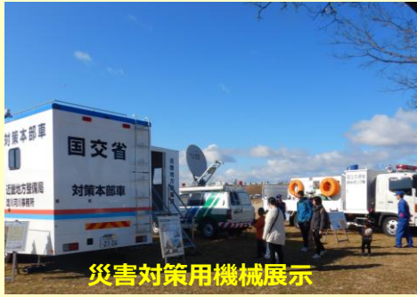
災害対策用機械展示