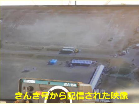
きんき号から配信された映像