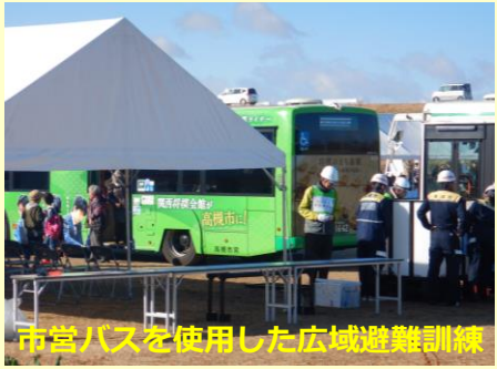
市営バスを使用した広域避難訓練