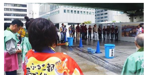
須知氏による開始宣言により開始