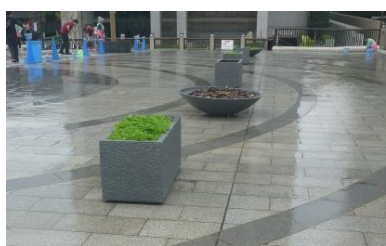
橋面もピカピカになりました！