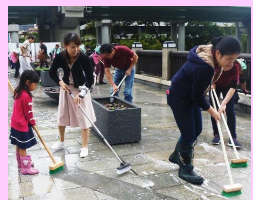
一般参加者と共に橋を洗いました～！