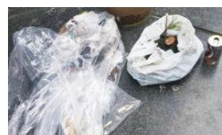
ゴミが沢山出ました～！