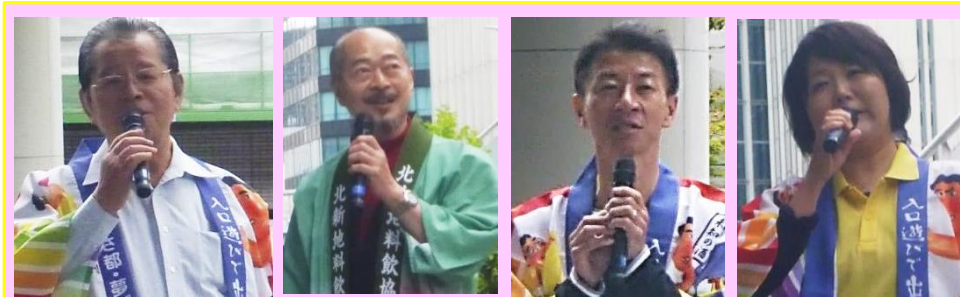
須知 なにわ八百八橋「橋洗い」実行委員長

防災の使命をもって生まれた平成の橋「中之島ガーデンブリッジ」の橋洗いは、人々が集い交流を生むこの橋を未来に残すべき財産として自分たちの手で「美しいまちづくり」活動の一貫であると考えて、皆で協力して大切な橋を洗いました！