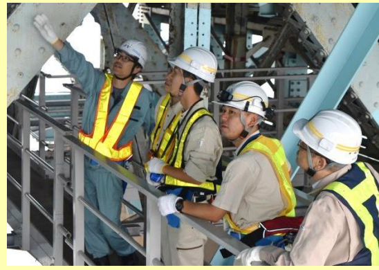
— 淀川大橋の橋の下から現地説明 —