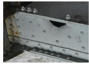
大阪大空襲による銃弾の貫通した銃弾跡

床版の漏水、コンクリートの剥離、鉄筋露出、橋桁の腐食など老朽による損傷が著しいため、抜本的に床版を取替るなど補修することにより、淀川大橋を健全な状態に保ちます。