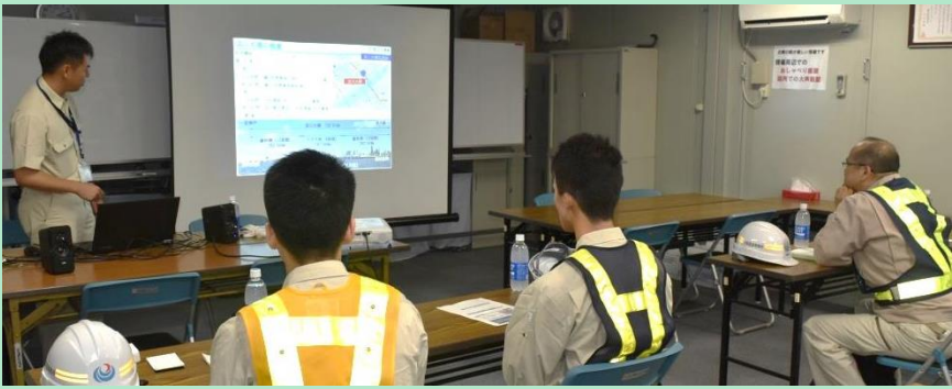
— 淀川大橋補修工事における説明 —