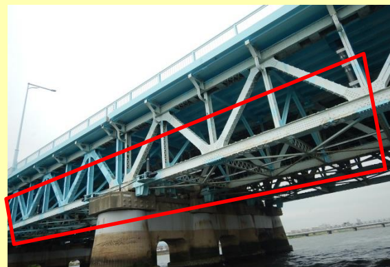
ここの中に入り、橋の状態を勉強