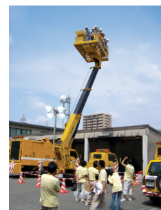
トンネル点検車両