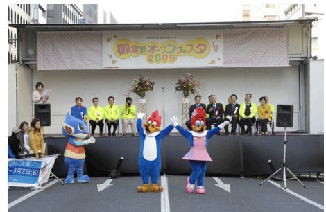
昨年のオープニングセレモニーの様様

実行委員長の關大阪市長の挨拶に始まり、御堂筋完成70周年と世界陸上の特別アピールを行います。