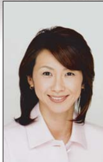
毛利 聡子 フリーアナウンサー