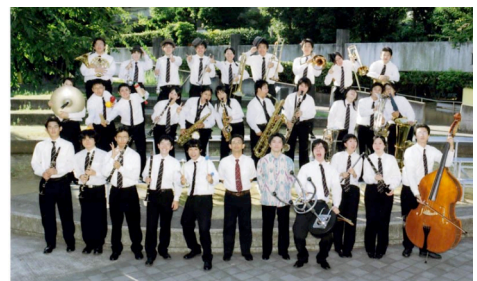
【大阪学院大学吹奏楽部】

御堂筋オープンフェスタ2007の始まりを告げるオープニングセレモニー・パレード。セレモニーに引き続き、大阪学院大学吹奏楽部の先頭で、トラッフィーや各ゾーンのイベント参加者たちが、御堂筋を行進します。華やいだパレードをご期待ください。