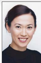
有森 裕子 オリンピックメダリスト