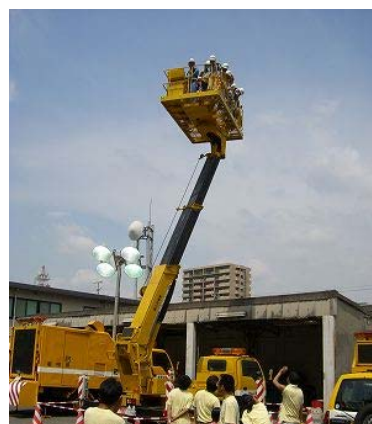
トンネル点検車 （乗車制限あり）