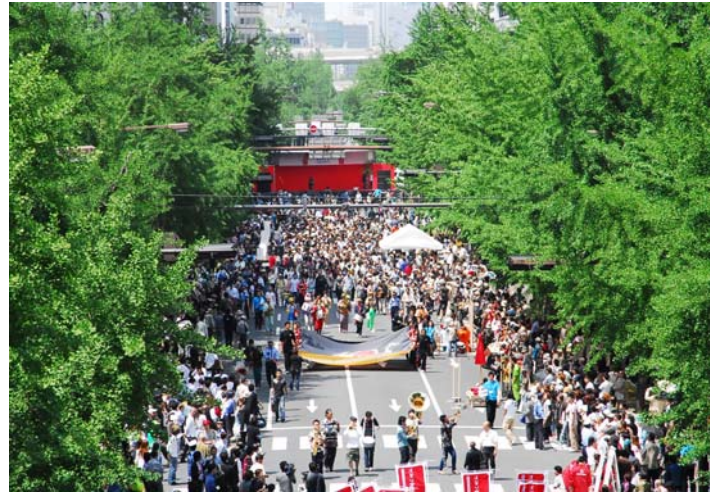
■ 市民や訪れる人々に親しまれる御堂筋 (御堂筋オープンフェスタ)