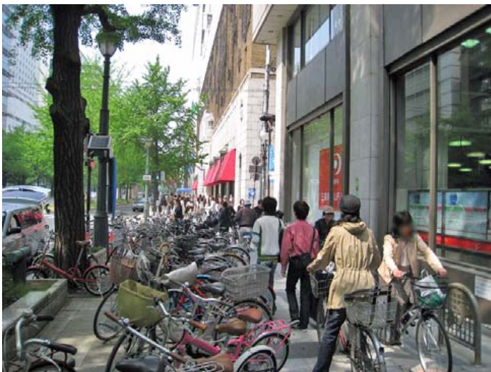
■ 放置自転車により歩道の幅員が狭まり、歩行者と自転車が錯綜する様子