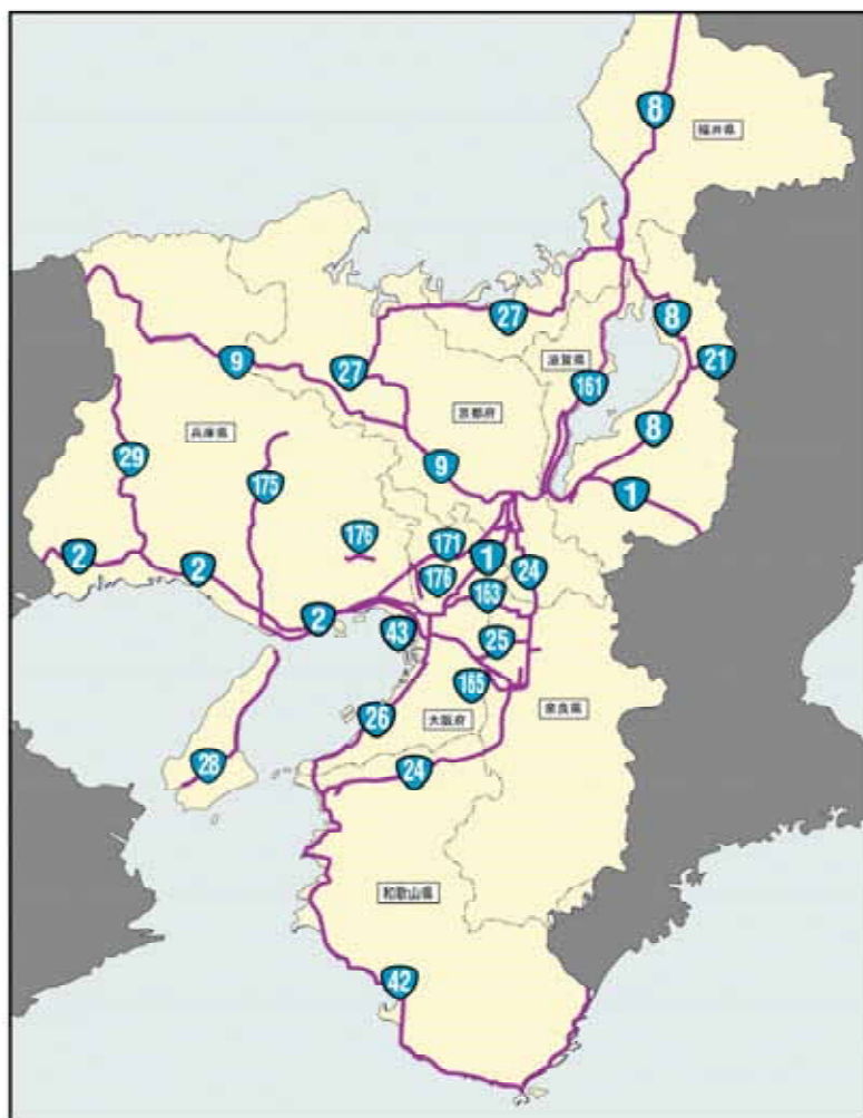
近畿地方整備局 直轄国道道路網図

なお、奈良県は先行して平成21年7月から8月にかけて既にアンケート調査を実施し、「みんなでつくる交通安全対策プラン」( http://www.pref.nara.jp/dd.aspx?menuid-17189.htm )としてとりまとめています。