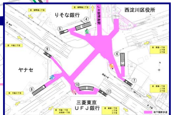
- 歌島橋地下歩道 -