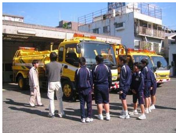
道路パトロールカー等についての説明