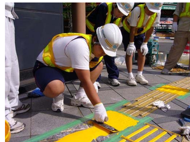
点字ブロックの張り替え体験