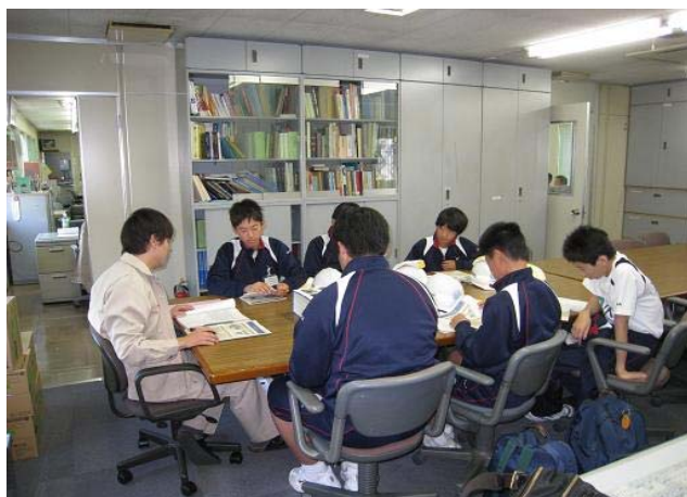
道路管理業務についての説明