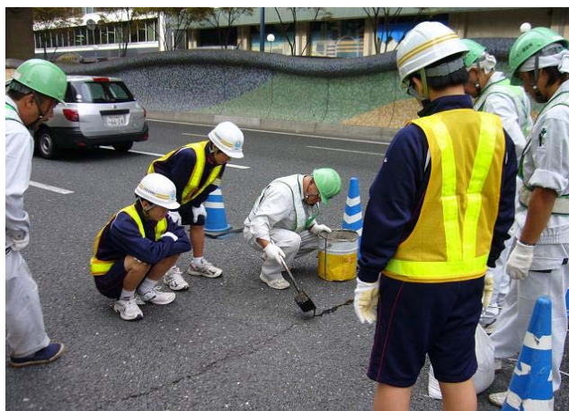
ひび割れ補修現場の見学