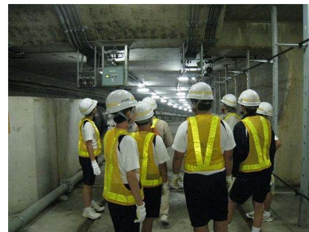
梅田共同溝内の見学