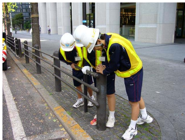
徒歩パトロール体験