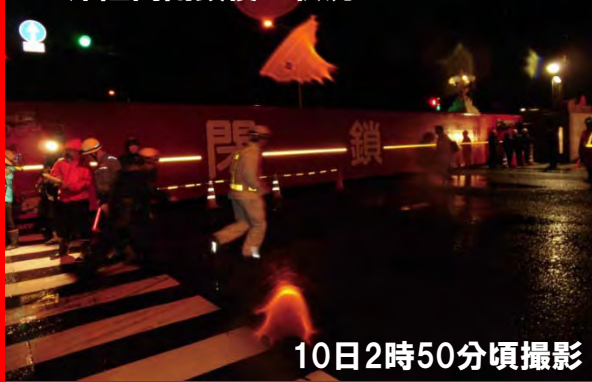
左岸陸閘閉鎖後の状況