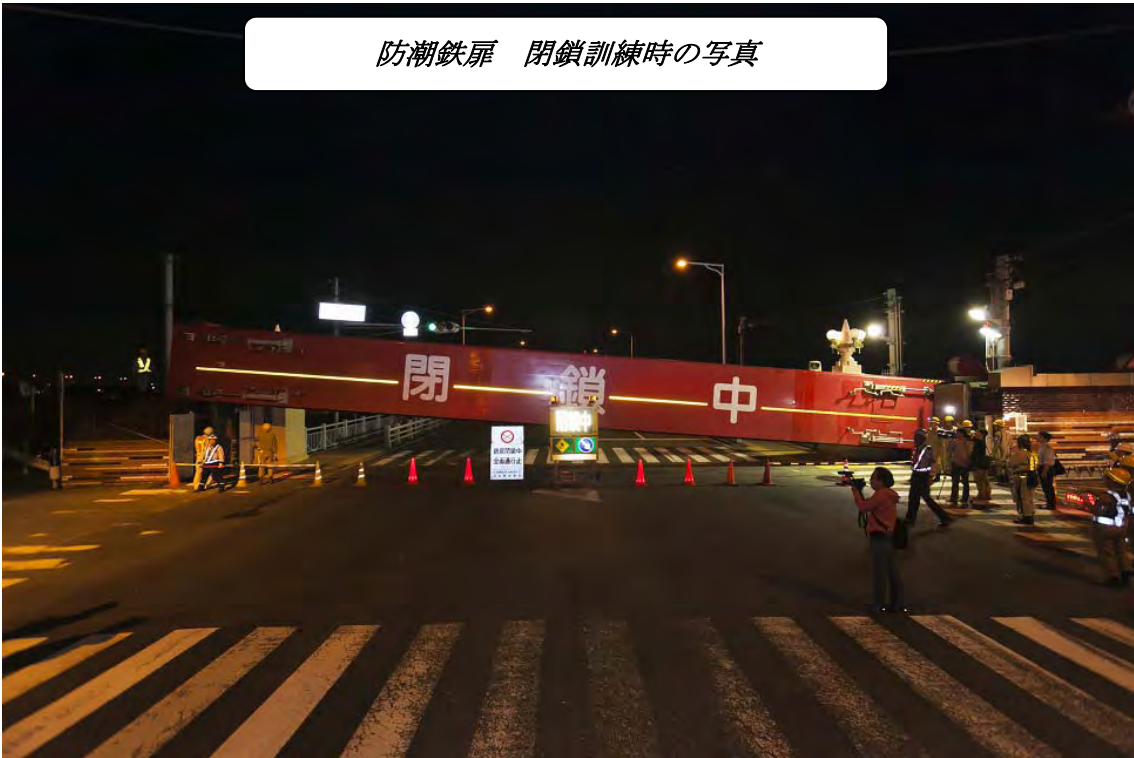
国道2号淀川大橋左岸側（資料2-①の箇所） 閉鎖訓練状況