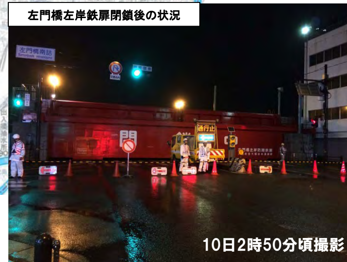
左門橋左岸鉄扉閉鎖後の状況