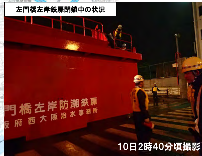
左門橋左岸鉄扉閉鎖中の状況