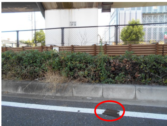
【7月20日(水)発見】 落下した鉄板 200mm × 225mm × 6mm