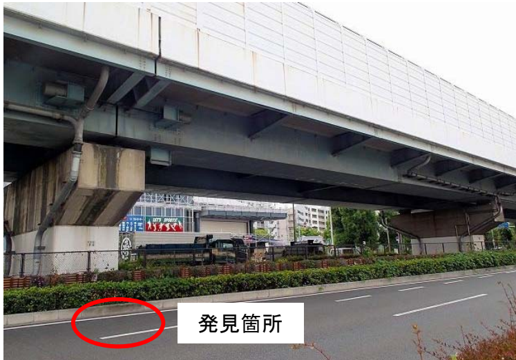
【7月20日(水)に落下が確認された場所】