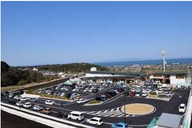
道の駅「みさき」(全景)