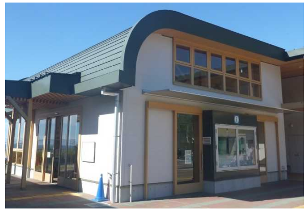
情報提供コーナー