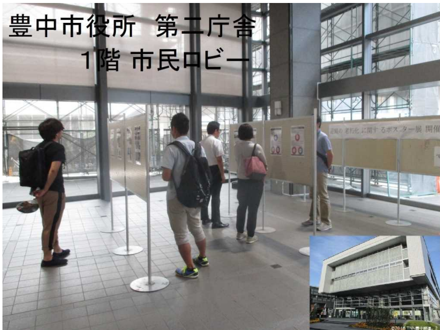
豊中市役所 第二庁舎 1階 市民ロビー