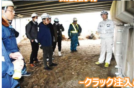
-クラック注入の説明-