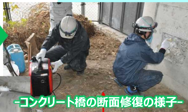
-コンクリート橋の断面修復の様子-