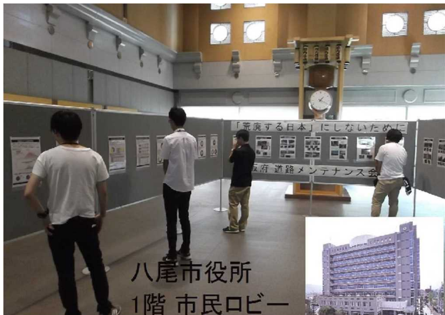
八尾市役所 1階 市民ロビー