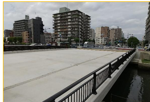
今後は西行き車線の工事を進めます。