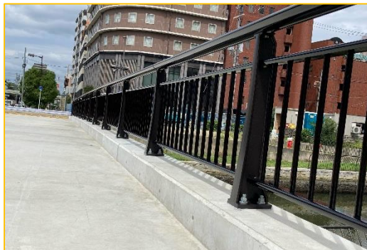
歩行者が転落しないように柵を付けています。