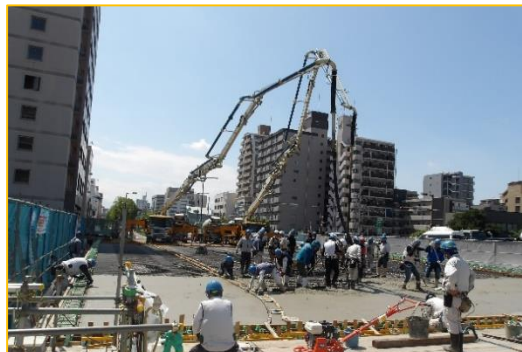
コンクリートを流し込んでいます。