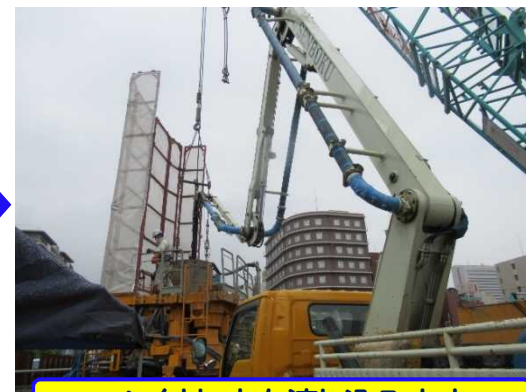
コンクリートを流し込みます