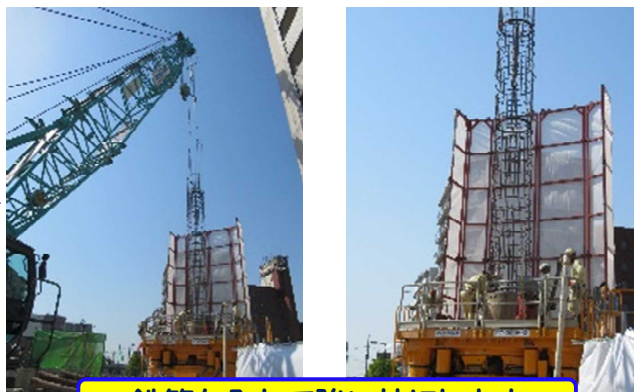
鉄筋を入れて強い杭にします