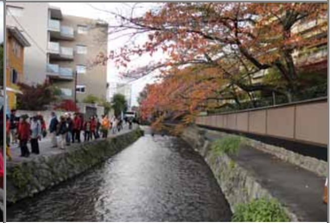
祇園白川(上流部)を散策している様子