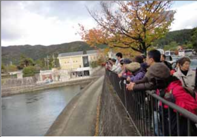
白川と疏水の合流部を視察しました