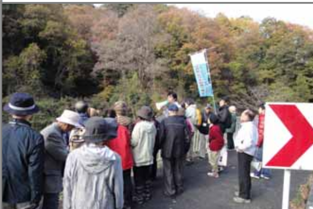
白川の源流域(大津市比叡平)を視察しました