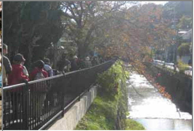
白川沿いの桜並木道を散策している様子