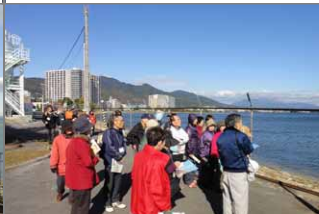
琵琶湖内の取水部分を視察しました