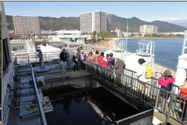
浄水場内の施設を見学しました