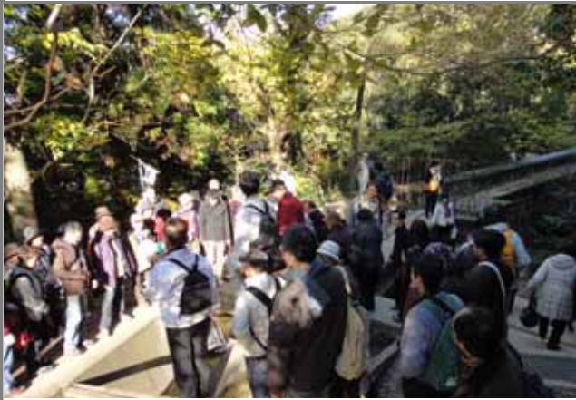
南禅寺水路閣の上部で疏水の流れをガイド