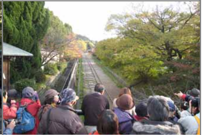
疏水インクラインを視察しガイドを受けました