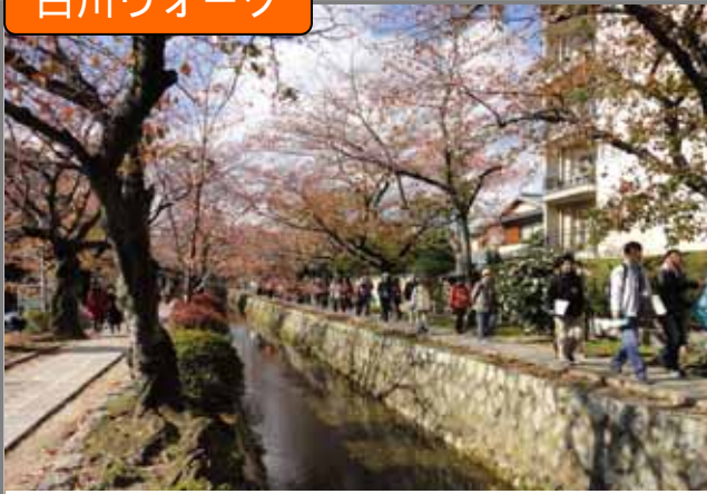
疏水分線の遊歩道を散策している様子