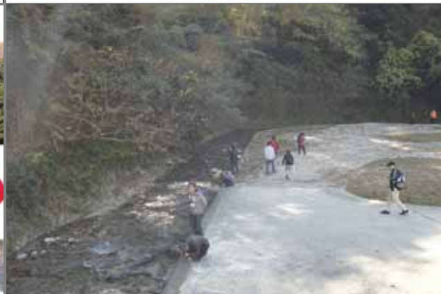
白川源流域(沈砂池)の川の様子を見学しました