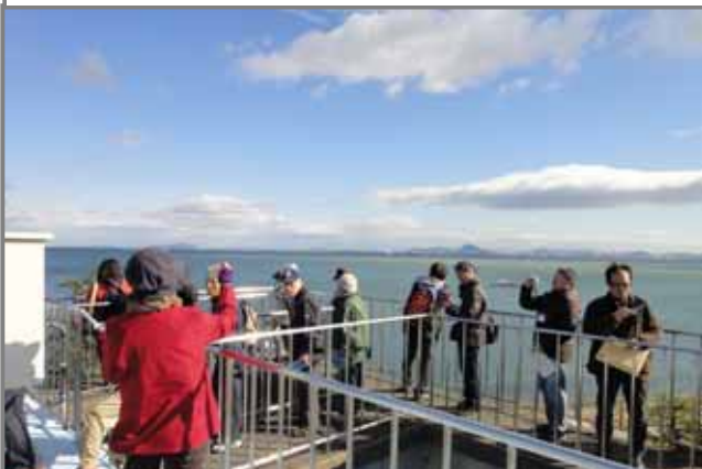
流域圏の大きな水源である琵琶湖を眺望しました