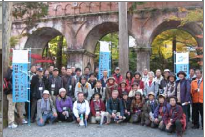
参加者揃って水路閣前で記念撮影をしました