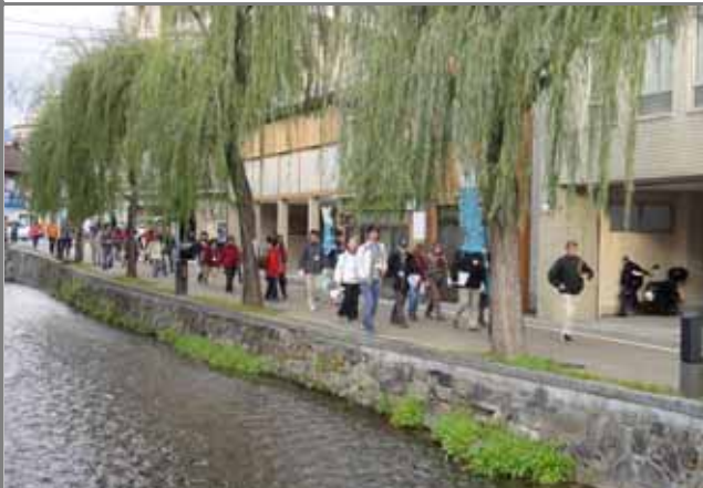
祇園白川(下流部)を散策している様子