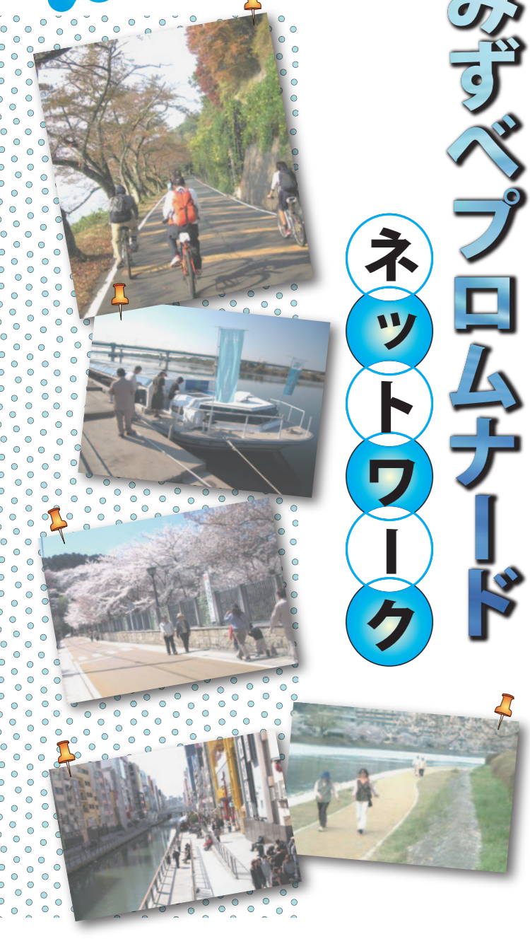
琵琶湖・淀川流域再生推進協議会