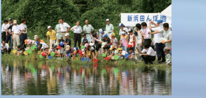
フナ稚魚の放流(滋賀県草津市)

みずべプロムナードの整備 淀川、木津川、桂川、猪名川などの各河川沿いや琵琶湖周辺に、舟運、サイクリング、ウォーキングで水辺をつなぐ「みずべプロムナードネットワーク」を構築しています。そのため、遊歩道、航路等の連続性の点検を行い、河川環境への影響や利用の動向を踏まえた上で、分断されている箇所の計画的な解消を図ることとしています。現在、みずべプロムナードは、ネットワークとして610.035kmが整備されています。(平成24年8月)