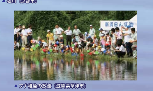
▲フナ稚魚の放流 (滋賀県草津市)