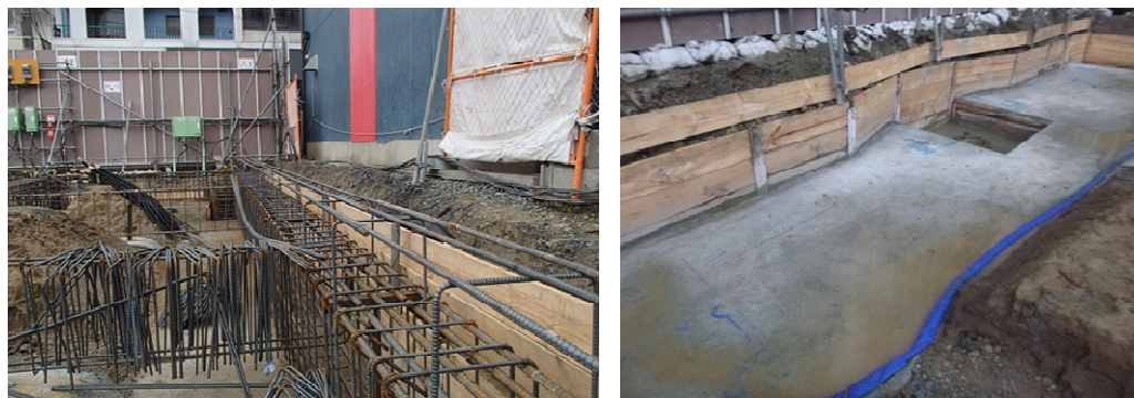
接近工法による施工

狭隘敷地における施工にて、接近工法を採用し発生土を削減したほか、コンクリートの打設回数、揚重機の使用回数を削減するための工夫が評価できる。