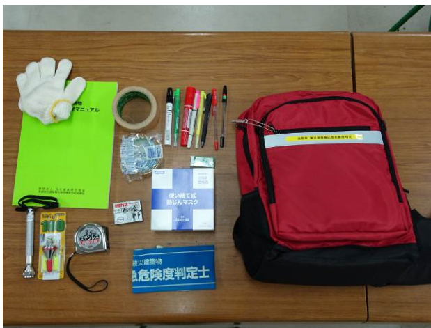
図-2 資機材準備状況

10時 兵庫県から「国土交通省から中四国ブロックおよび近畿ブロックに支援準備要請があった」との連絡があり。登庁した職員により、資機材の確認、準備を実施。また、熊本県では15日から被災建築物応急危険度判定を開始していたが、本震の発生により16日の活動は中止するとの情報。