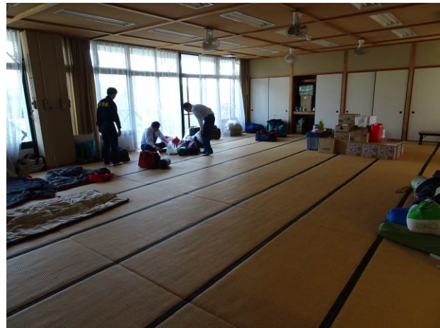
図-3 宿舎宿泊室(熊本第二高校セミナーハウス)

宿舎であるセミナーハウスに入る。2階の畳敷き48畳大広間の一角に4名分の陣地を確保し、3夜の宿とした。