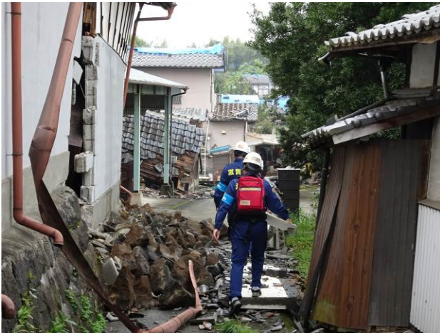
図4 判定活動状況（御船町高木地区）

実施本部での終了ミーティングの際に、翌日は判定地域である宇土市へ直接集合されたいとの指示があった。