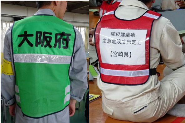
図5 作業用ベスト背面（協力：大阪府，宮崎県）