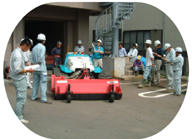
九頭竜川出張所での講習会 (H17. 6. 15)