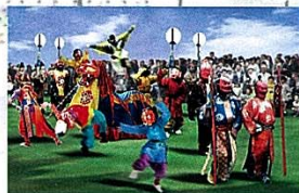
あをによしパレード

現在復原中の「第一次大極殿正殿」が公開される特別史跡「平城宮跡(奈良市)」では「平城京歴史館」や「遣唐使船復元展示」、「平城京なりきり体験」などの参加型展示・催事を展開。