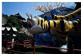
信貴山朝護孫子寺