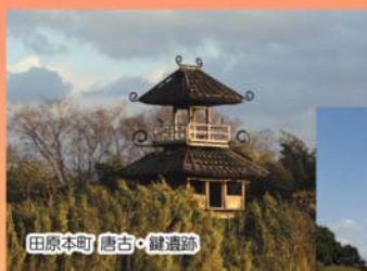
田原本町 唐古・鍵遺跡