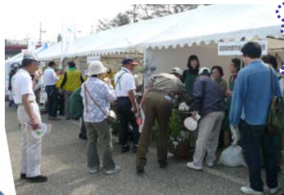
メイン会場の様子