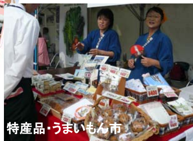
特産品・うまいもん市