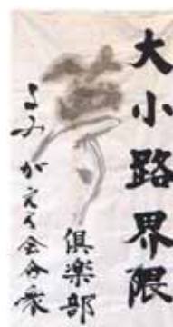
大小路界隈『夢』倶楽部