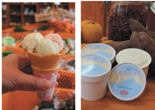
市場に併設された工房で製造されるジェラート