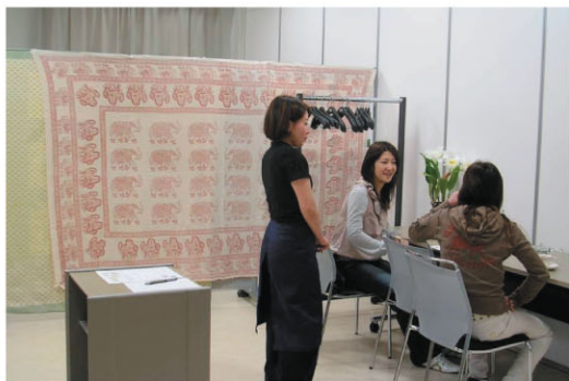
エステ出張サービス