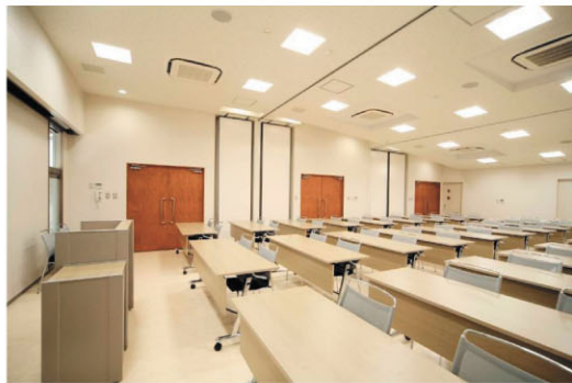
会議・講演会用配置