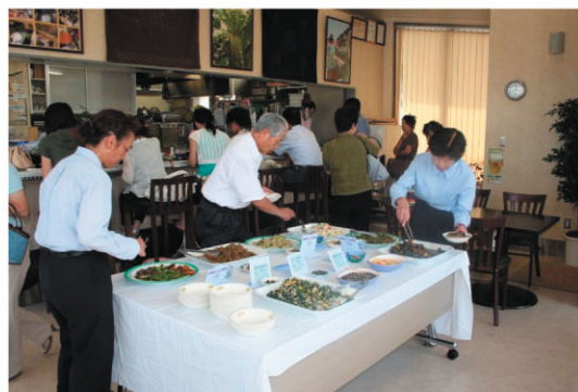
地元生産者による野菜料理バイキング