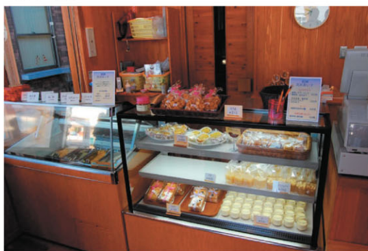
地元のケーキ作りグループによるスイーツ出品