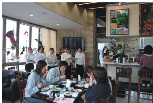
合唱グループの店内ライブ