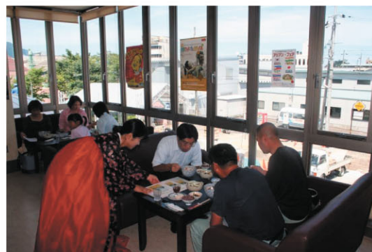
韓国人グループによる本格韓国料理