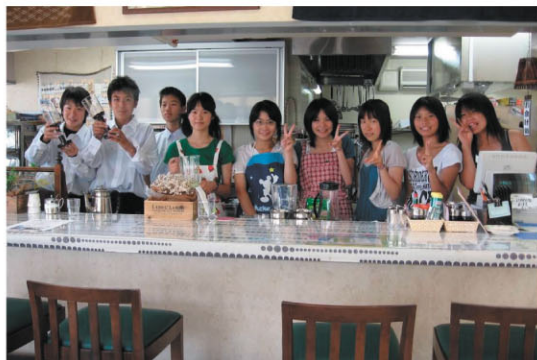
地元中学生の海外派遣報告