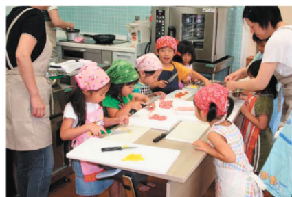
左上：施設全景 左下：フリーショップ開催風景 中下：親子トイレ 右上：親子グループによる小パーティ 右下：子供料理教室の様子