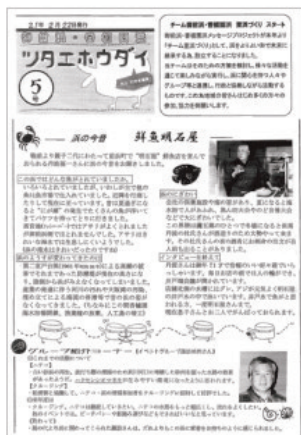
浜の情報誌「ツタエハウダイ」