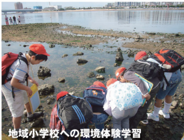
地域小学校への環境体験学習