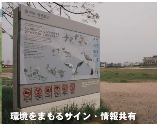
環境をまもるサイン・情報共有