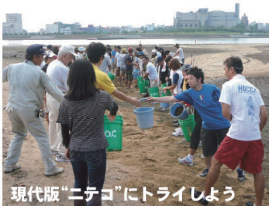
現代版“ニテコ”にトライしよう