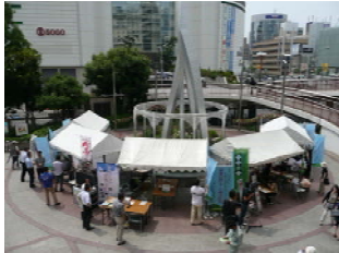
JR三ノ宮駅前で開催(H21.6.27)