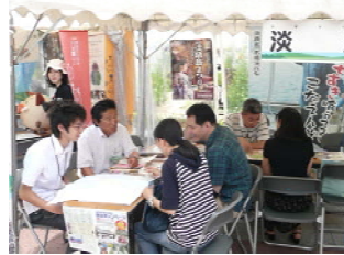
JR三ノ宮駅前で開催(H21.6.27)