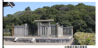
白鳥陵古墳の測量図