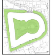
白鳥陵古墳の測量図 【羽曳野市史】第3巻より(一部着色)

被葬者とする日本武尊は第12代景行天皇あり、妃紀には、西は熊襲、東は蝦夷の討伐、伊吹山の神に害されて亡くなった悲劇の英雄とされる。その体は大きな白鳥に変わり、三市の鹿嶋野(のぼ)から奈良県御所市の磐井はらを経て、古市で羽を曳いて天に飛び立日本書紀に記されている。羽曳野の名もそれぞれの地に設けられ、白鳥三陵とい。古市では明治13年(1880)この前の山本武尊陵に治定された。