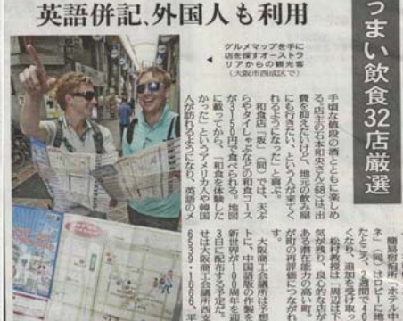
2012年5月16日『朝日新聞』朝刊 2012年5月26日『読売新聞』朝刊