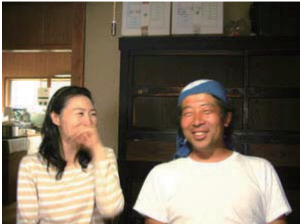
平成10年4月堺市から移住