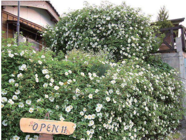
京丹後オープンガーデンネットワーク H17から開催