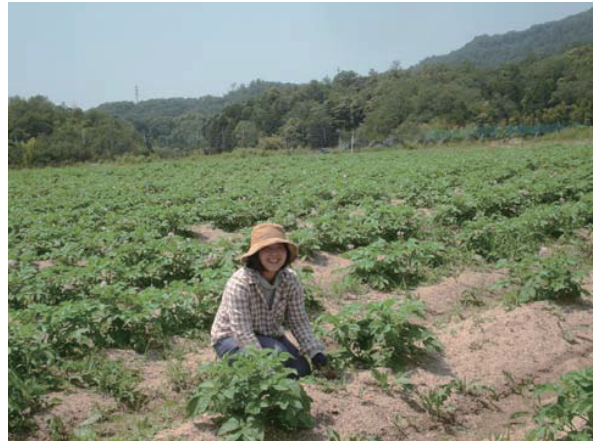
平成26年5月枚方市から移住