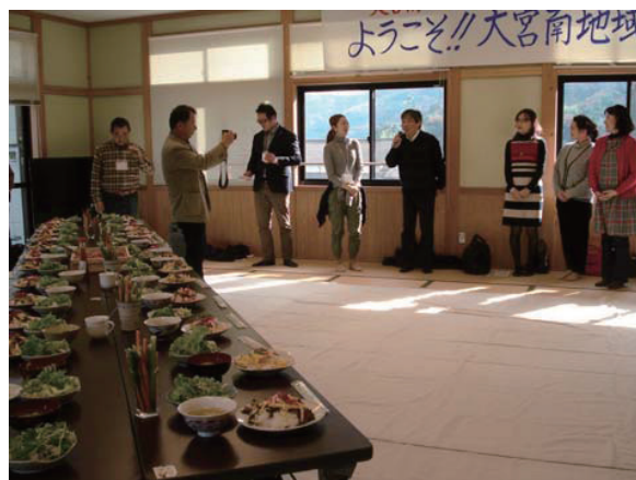
名物のばらずしでおもてなし