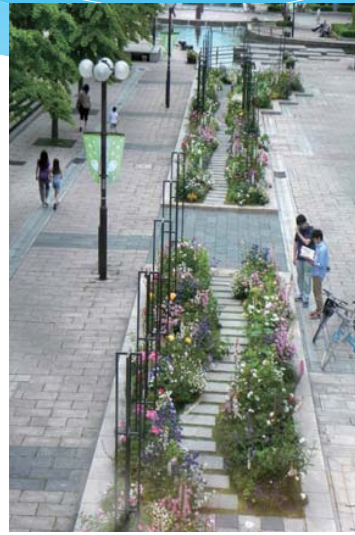
人工河川支流を花壇に変更