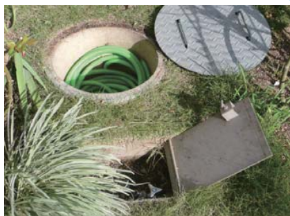
散水栓とホースの収納場所