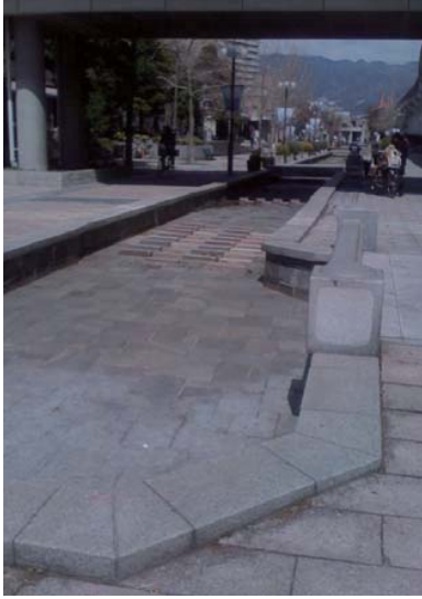
漏水のあった人工河川支流