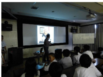
学校地域セミナー