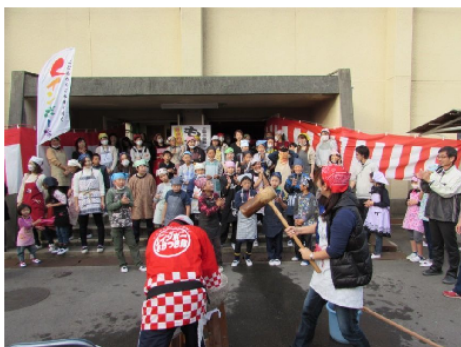
レインボー餅つき隊