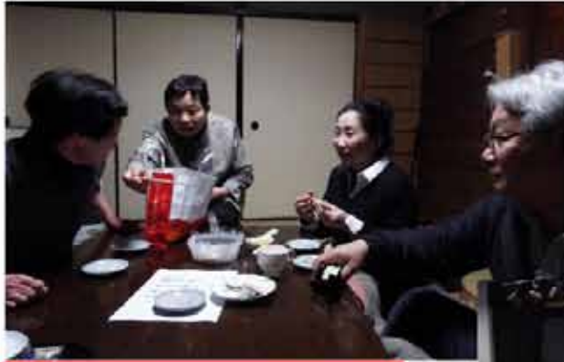
おぼんざい研究会交流