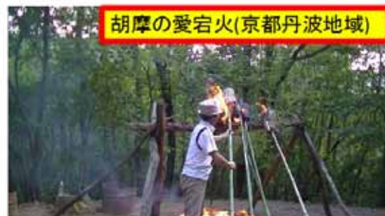
胡摩の愛宕火(京都丹波地域)