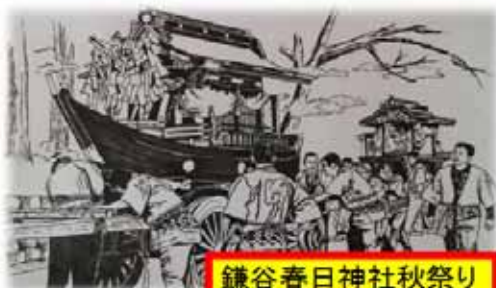
鎌谷春日神社秋祭り