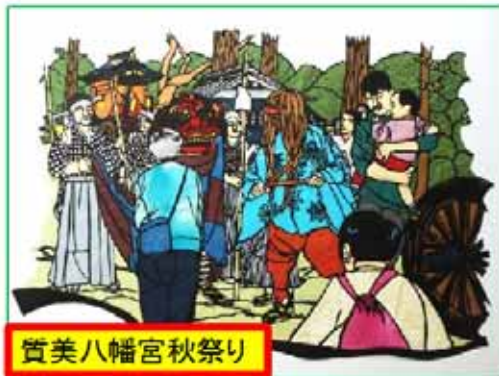
賞美八幡宮秋祭り