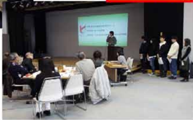
亀岡市民団体交流