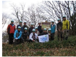
バナソニック電工松寿会阪神地区 フォレスター松寿