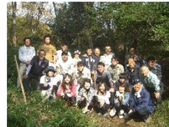
東京海上日動火災保険株式会社