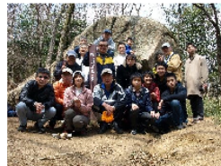
東亜バルブエンジニアリング株式会社