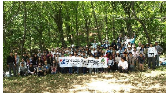
コベルコシステム株式会社