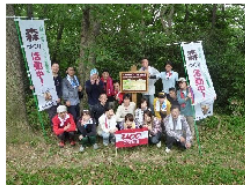
UCC上島珈琲株式会社