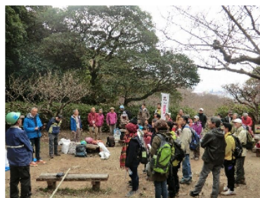
笑顔で閉会の挨拶