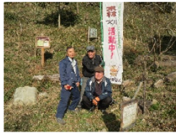
ほくらぐるーぷ (山林ボランティア)