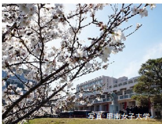
甲南女子大学・甲南大学 神戸薬科大学