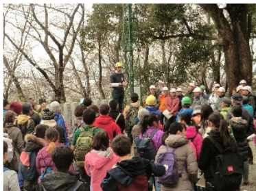
開会は英語スピーチでスタート