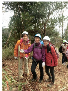
ワタシノ「サクラ」デース！