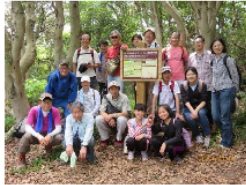
ウェルネスの森を守る会