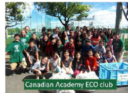
カナディアン・アカデミー