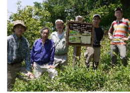
清水建設株式会社