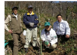
全島山自然環境保護・青山協議会