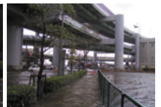
台風18号による越波被害の様子 (神戸大橋付近)