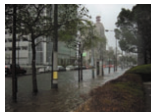
高潮により市街地が冠水 (平成16年台風18号)

平成16年の台風被害を踏まえ、国、神戸市等の関係機関により「神戸港における高潮対策検討会」を設置し高潮対策を推進していきます。