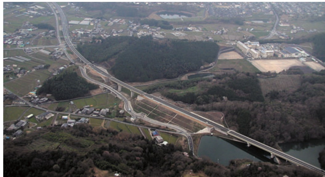
京名和自動車道：五條市岡地区付近