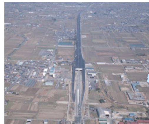
京名和自動車道：橿原北IC付近から北を望む