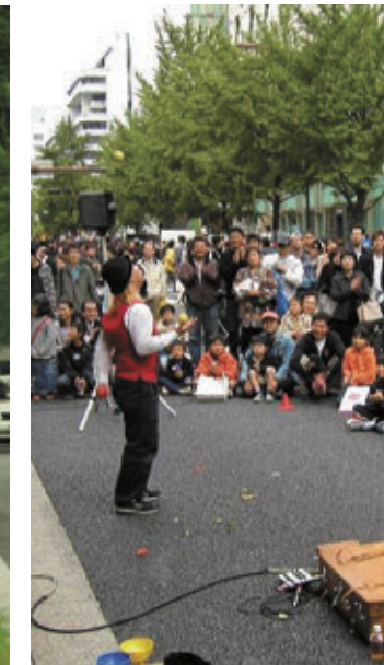
御堂筋オープンフェスタ2005での路上パフォーマンス