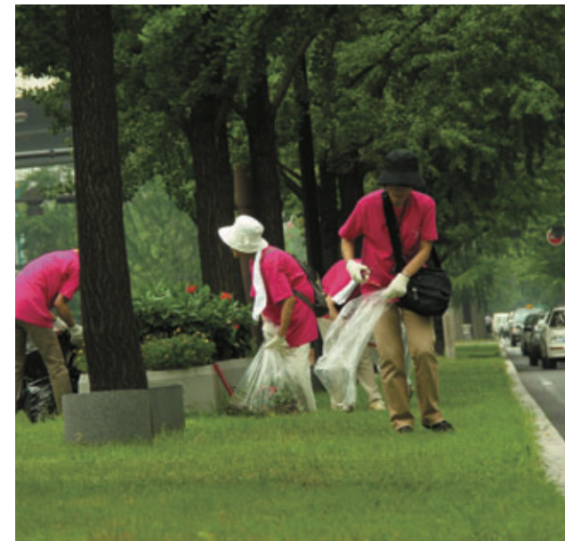
御堂筋の分離帯を清掃する清掃ボランティア