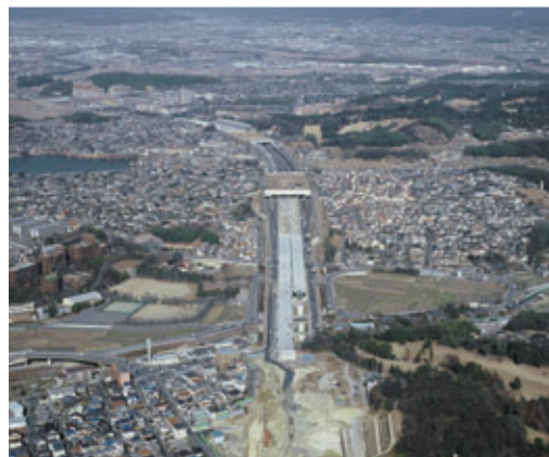
第二京阪道路：枚方東インターチェンジ付近