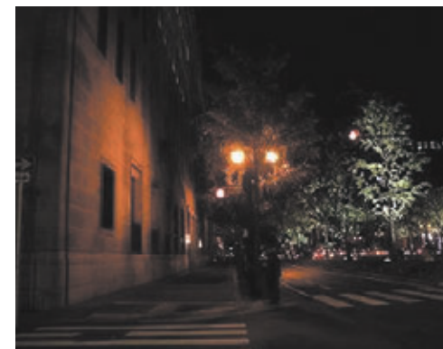
平成17年度に実施した夜間照明実験（左：実験実施前、右：実験実施中）