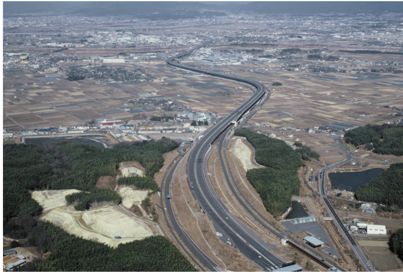
第二京阪道路：八幡市内上空から京都市方面を望む