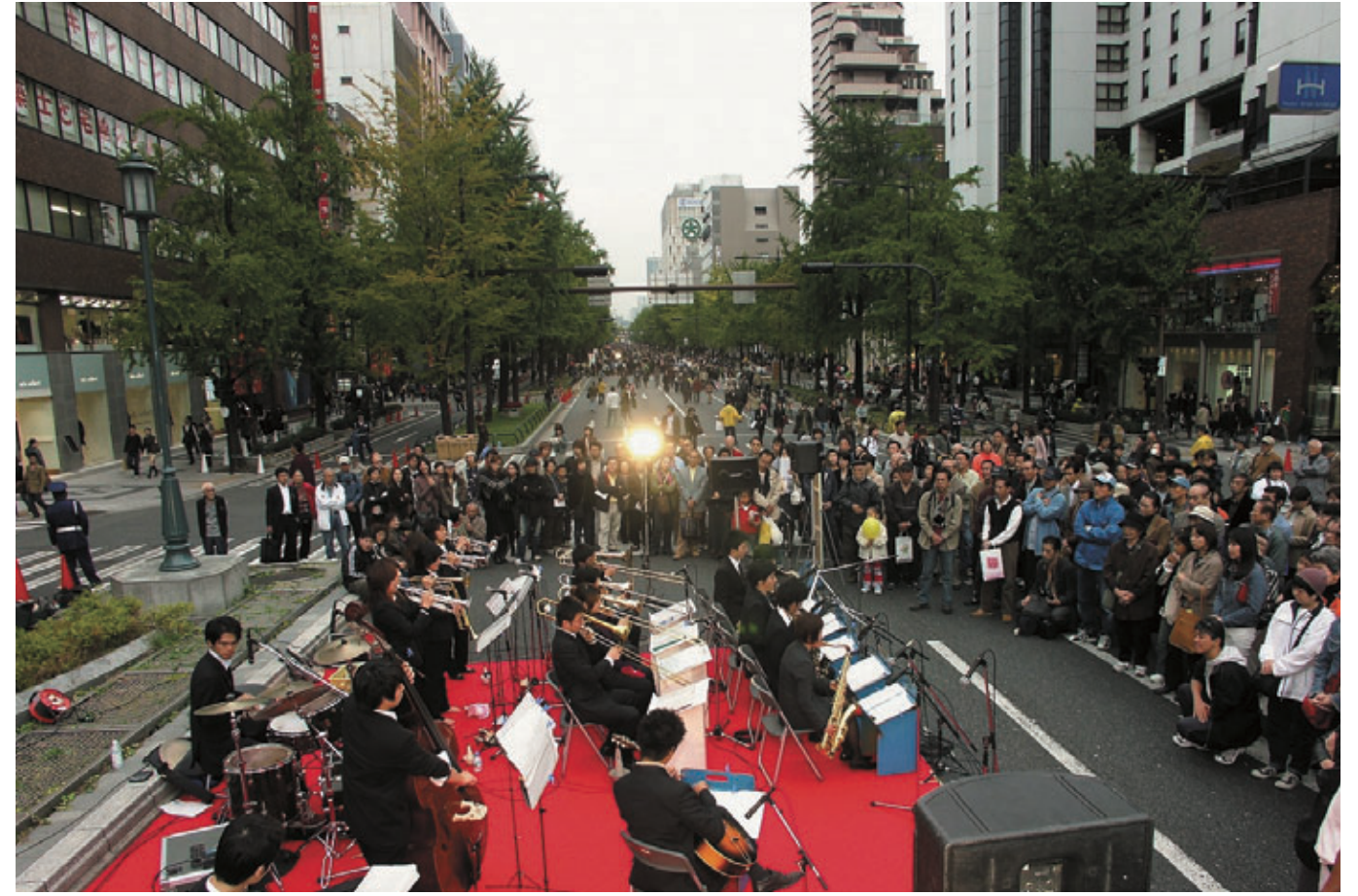
御堂筋オープンフェスタ2005で演奏を披露する楽団