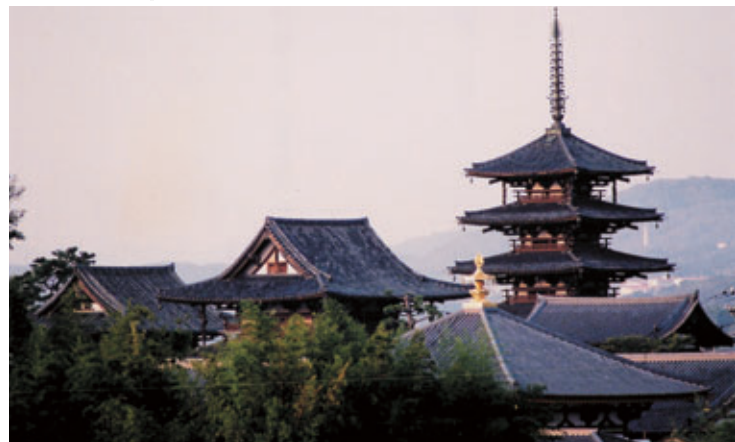
1993年12月 姫路城とともに日本で初の世界文化遺産に指定された法隆寺（遠景）