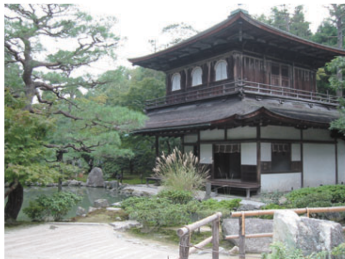
「古都京都の文化財」として世界遺産登録された銀閣寺