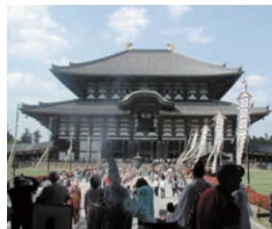
「古都奈良の文化財」として世界遺産登録された東大寺