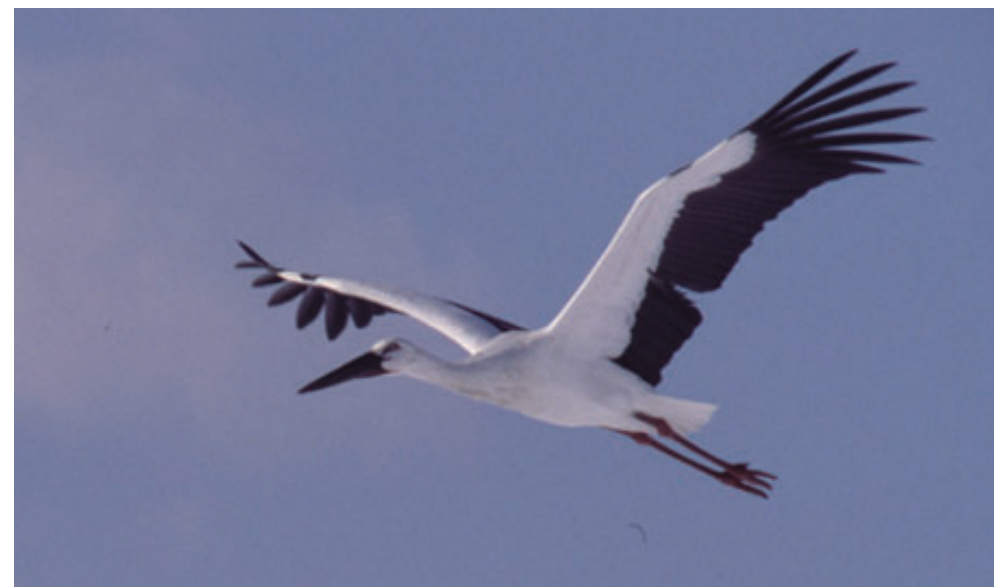
飛行訓練を行うコウノトリ