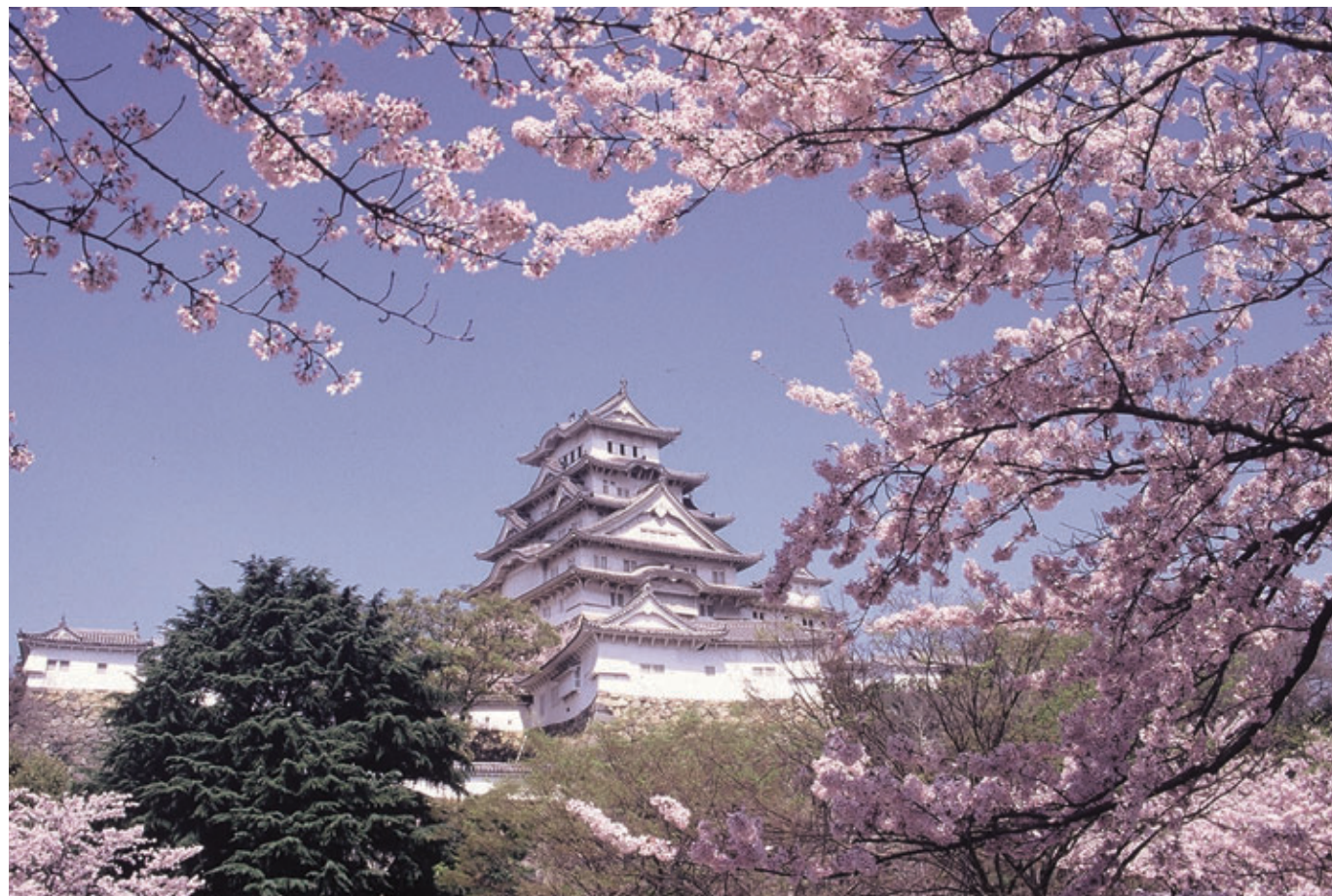
1993年12月 日本で初の世界文化遺産に指定された姫路城