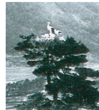
コウノトリの営巣地となった出石町の「鶴山」

コウノトリの野生復帰推進 我が国に生息する野生のコウノトリが、兵庫県但馬の地で絶滅して30年余が経過します。近畿地方整備局を含む関係機関や地域住民が連携し、豊かな自然を守り育てるさまざまな取り組みを進める中、平成17年9月には試験放鳥が行われました。