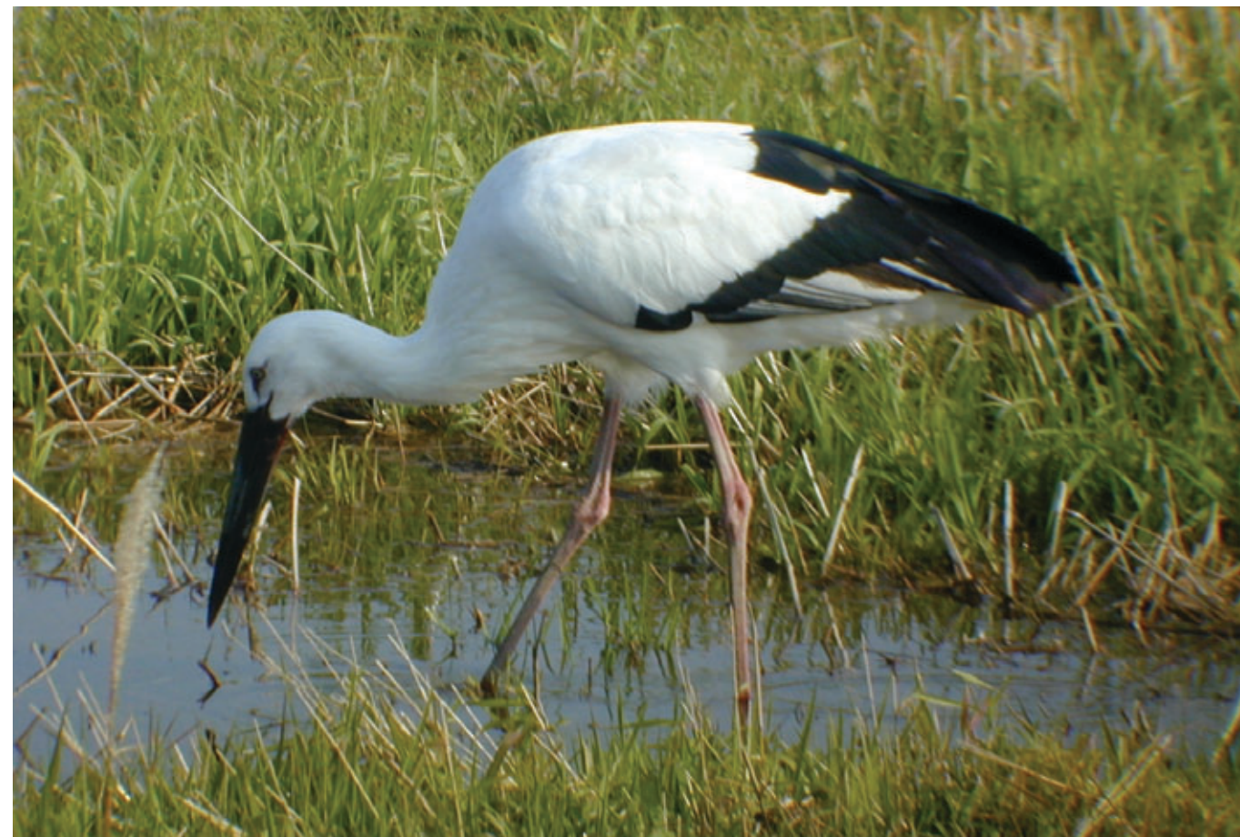
円山川に舞い降りた野生のコウノトリ

我が国の歴史の中で永々と築きあげられてきた近畿には、多数の歴史遺産がありますが、そのうち世界に誇りうる「世界遺産」が5つあります。その遺産を守り育てるための環境整備とまちづくりに取り組んでいます。