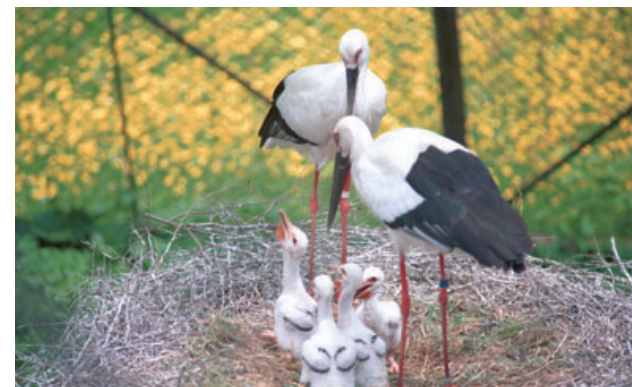
初めて誕生したコウノトリのヒナ