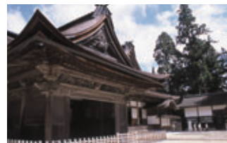
「紀伊山地の霊場と参詣道」として世界遺産登録された高野山金剛峰寺