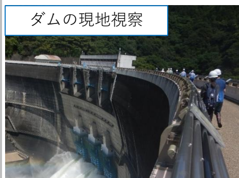
ダム の 現地視察