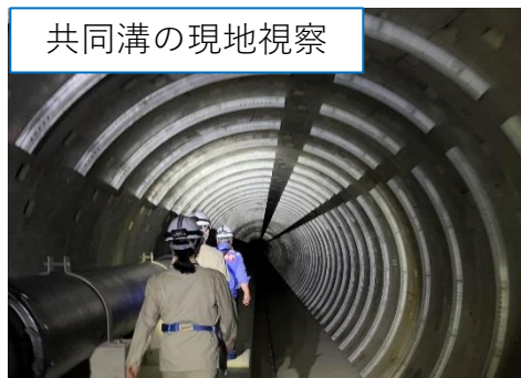
共同溝の現地視察