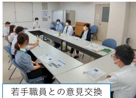
若手職員との意見交換