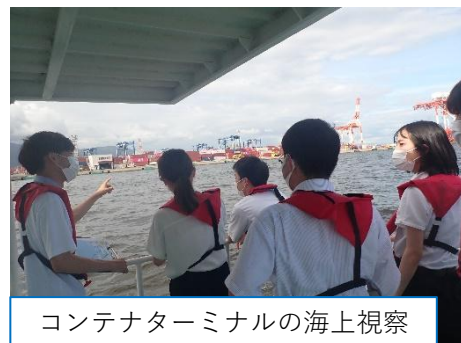
コンテナターミナルの海上視察