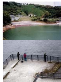
出合地区 なぎさ、多目的広場