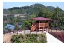
洲張地区 展望台、遊歩道

国崎地区にある知明湖キャンプ場やせせらぎ水路、なぎさ等は、整備地区の中でも特に来訪者の多い地区になっています。多くの利用者に安全かつ快適に利用して頂くため、知明湖キャンプ場では、指定管理者制度を導入しています。指定管理者は財団法人一庫ダムレクリゾートセンター(所管は兵庫県知事)となっており、地域の雇用機会の創出にもつながっています。