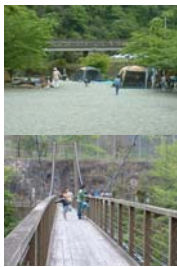
龍化地区 遊歩道、龍化吊橋、 千軒キャンプ場