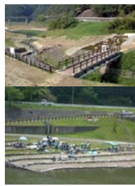
国崎地区 せせらぎ水路、池・滝・な ぎさ、知明湖キャンプ場等