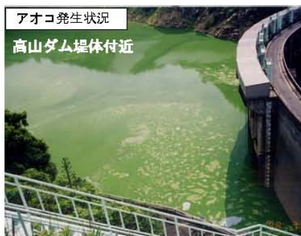
アオコ発生状況 高山ダム堤体付近

高山ダム流域では名張市等でのベッドタウン化が進行し、汚水の増加によって貯水池内では富栄養化現象が見られるようになりました。昭和59年頃からはアオコ、また昭和60年頃からは淡水赤潮が発生し、これら植物プランクトンの異常発生に伴う水質・景観の悪化に対して改善が求められていました。