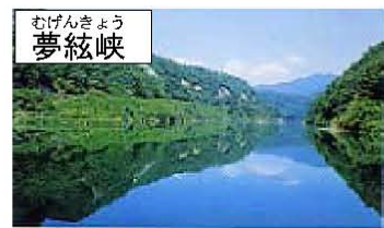
むげんきょう 夢絃峡